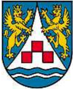
Wernstein a. Inn